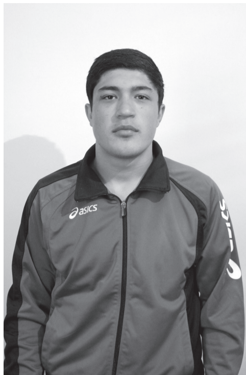
ла гьезие тIоцебесеб иргаялда шулияб сахлъи ва жеги гIемерал бергьенлъаби.

РакI-ракIалъ баркула вацал Мусаевазда чIахIиял бергьенлъаби, гьару-