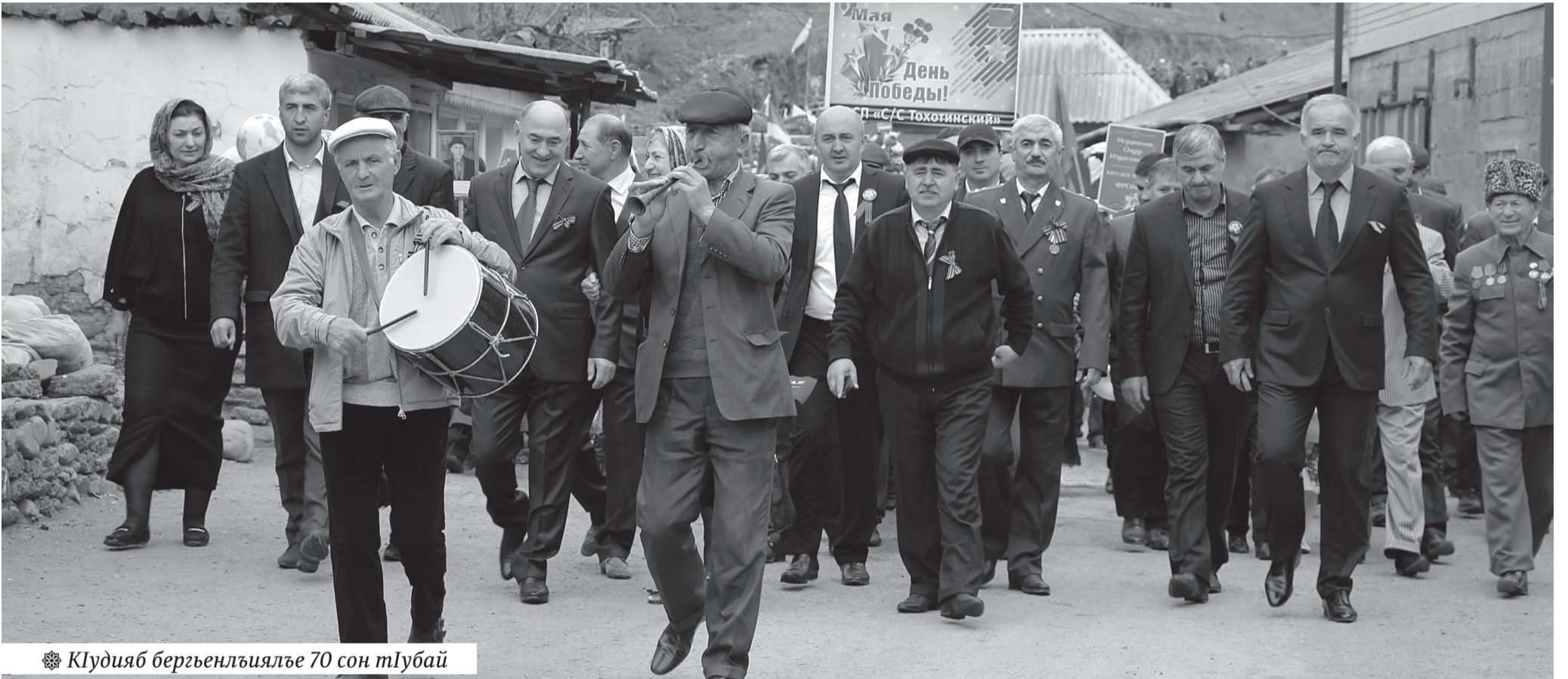
✿ КӀудияб бергъенлъиялъе 70 сон тӀубай

ЛъаратӀа районалъул муниципалияб гӀуцӀи, Райсобрание, Райадминистрация, Редакция