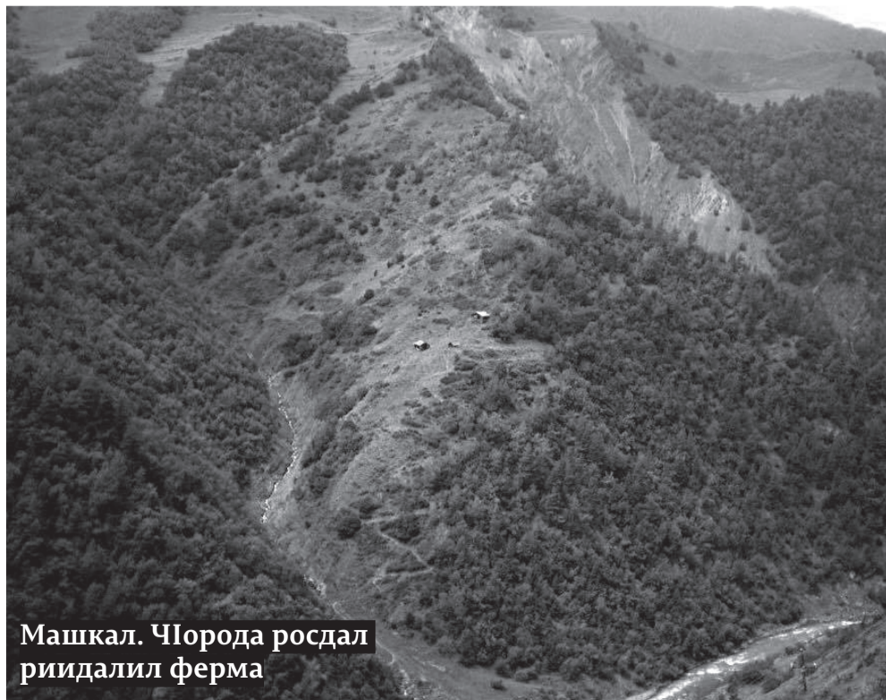
Машкал. ЧIорода росдал риидалил ферма